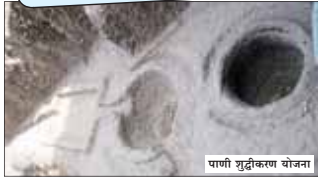
पाणी शुद्धीकरण योजना