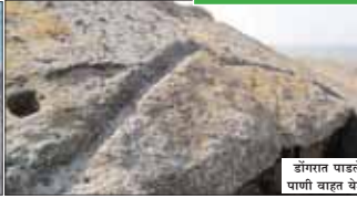
डोंगरात पाडलेल्या चिरामंथून पाणी वाहत येऊन टाकीत पडते